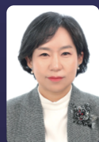
이꽃메 교수 상지대학교