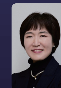
서은영 교수 서울대학교